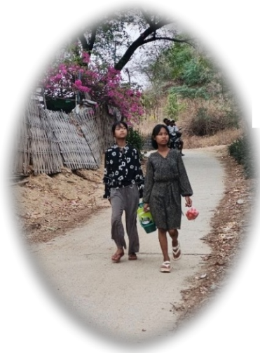
Auf dem Heimweg von der Arbeit mit ihrer Cousine.