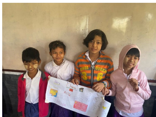
Grade 5 presentation & Grade 1 group activities