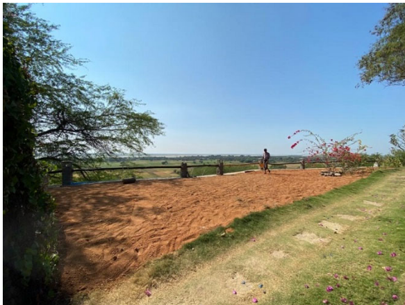
view from the top...

innumerable truckloads of sand were also needed to fill up the huge gap between the wall and the previous edge of the terrain. This new land is being planted with grass & flowers and will give welcome space in front of the rooms for guests to sit and relax