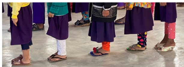
Extra layers of warm clothes are welcome