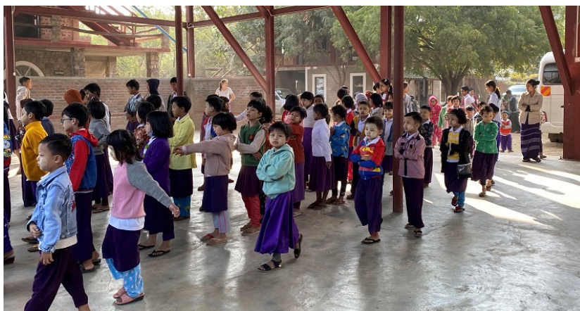
Children rushing to attend assembly on a cold February morning

On a brighter note, I would nonetheless like to share some of the highlights and facts & figures of the first months of 2020 at LOL and LTG with you.