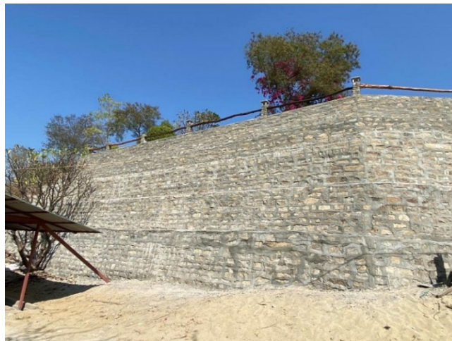
... to the finished wall