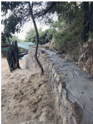
from modest beginnings...