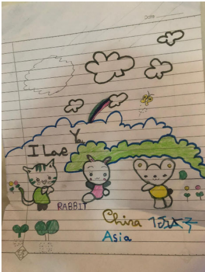
Mein erstes Bildgeschenk von einem Schüler

Ich bin weder Lehrer, noch kann ich gut Englisch, aber der Technikunterricht in Englisch scheint bei den Schülern von Grade 7 und 9 recht gut anzukommen. So starten wir mit „All about motorbikes“ und lernen mit Hilfe von YouTube die wesentlichen Teile des Motorrads in Englisch kennen.